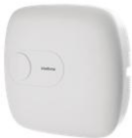
Central de Alarme

A central de alarme é o cérebro de todo o sistema. Ela controla todos os outros equipamentos e identifica a anormalidade e informa ao usuário de diferentes formas.